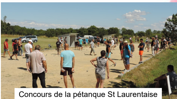
Concours de la pétanque St Laurentaise