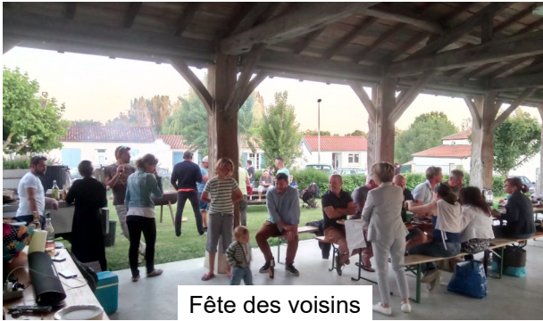
Fête des voisins