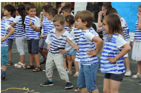
Fête des écoles