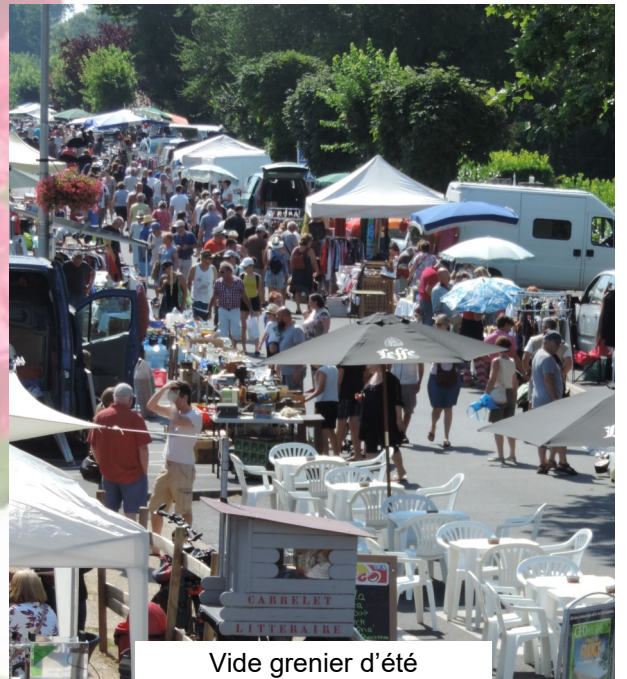
Vide grenier d'été