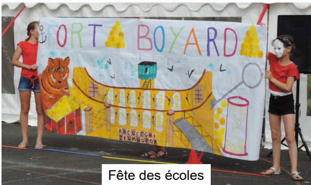
Fête des écoles