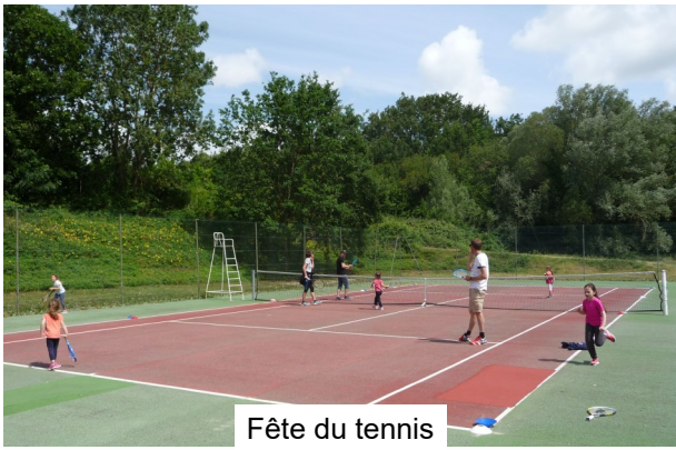
Fête du tennis