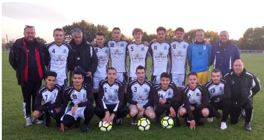
L'équipe senior A

Tous les joueurs et dirigeants, sont très fiers de leurs parcours, et remercient les municipalités de Fouras et Saint Laurent, ainsi que leurs sponsors de les avoir accompagnés tout au long de cette saison.