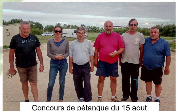
Concours de pétanque du 15 aout