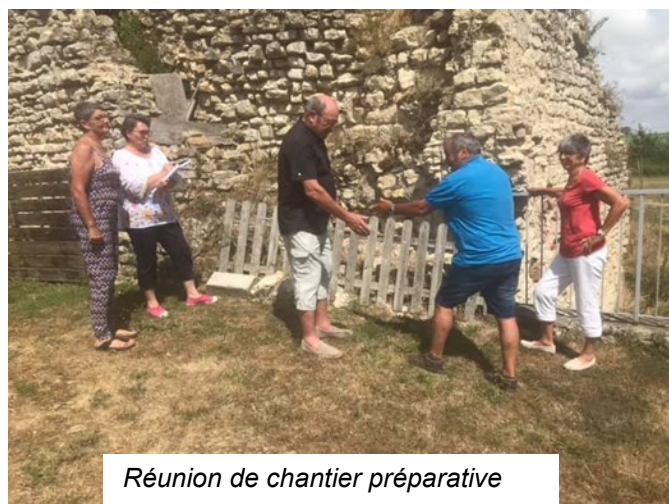
Réunion de chantier préparative