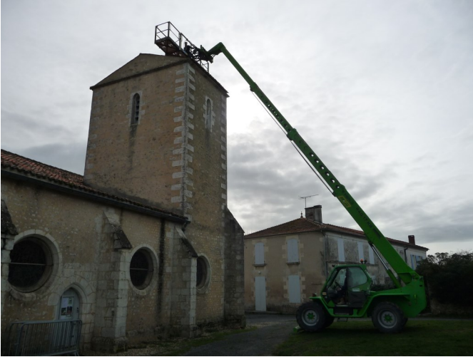
Réparation des toits de l'église