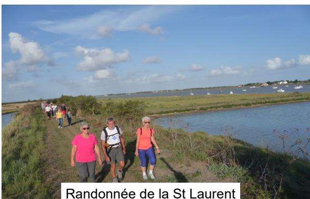
Randonnée de la St Laurent