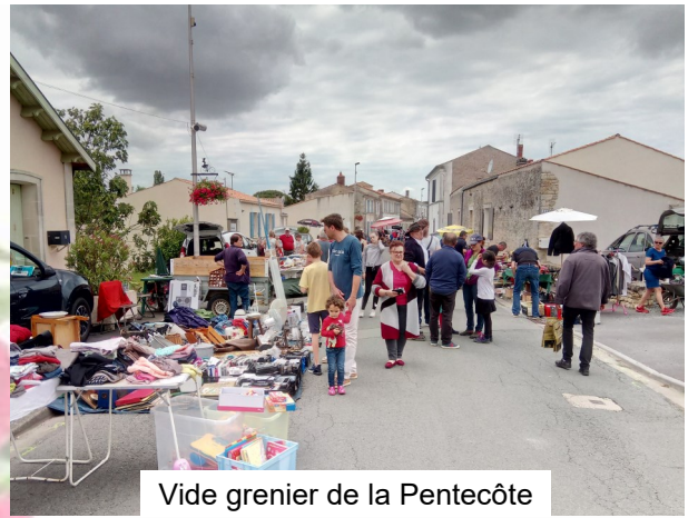
Vide grenier de la Pentecôte