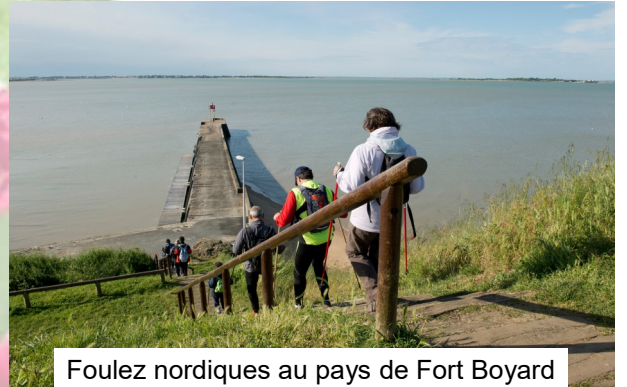
Foulez nordiques au pays de Fort Boyard