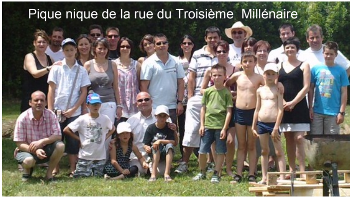
Pique nique de la rue du Troisième Millénaire