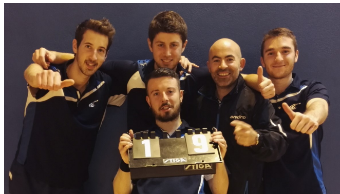
Les garçons heureux après le match de la montée

Le club pongiste atteint son plus haut niveau, en filles comme en garçons, l'année de ses 50 ans d'existence (1967-2017) !! Lors de leur seconde tentative, les féminines accèdent à la Nationale 2 après avoir réalisé l'exploit de s'imposer face aux favorites les bretonnes de Thorigné, 8/6. Les garçons, après 4 tentatives infructueuses, décrochent enfin le Graal. Dominatrice tout au long de la phase, l'équipe de la presqu'île a montré que sa place était en Nationale 2. Avoir deux équipes en Nationale 2, c'est exceptionnel !