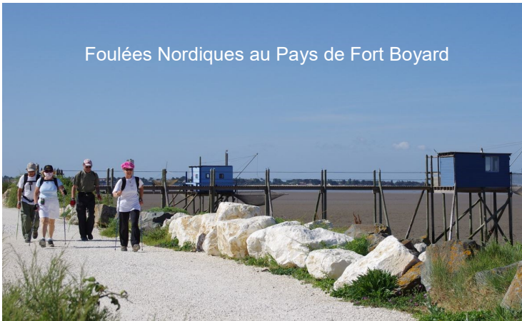
Foulées Nordiques au Pays de Fort Boyard