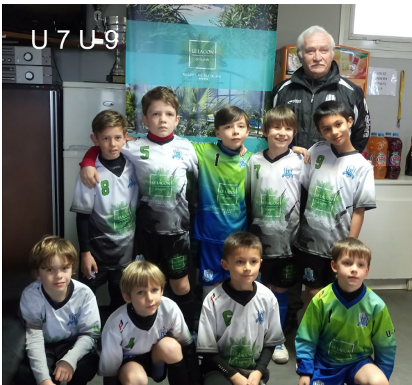
Remise des équipements offerts par le « Lagon de la Prée » pour les jeunes du Football Club Fouras / St Laurent