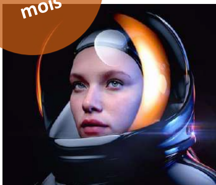
Photo du mois

Une jeune Saint Laurentaise envoie une lettre d'amour dans l'espace