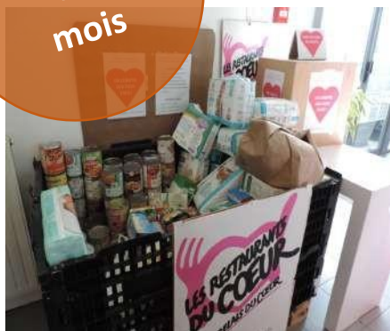
Photo du mois

Opération « Associative » de collecte pour les Restos du Cœur...