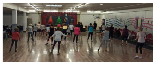
Photo prise pendant les cours donnés par l'association à Rochefort