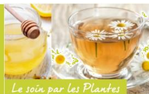
Le soin par les Plantes