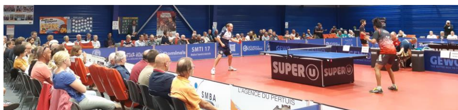
Vue de la salle durant un match de N1

Toutes les infos sur le site : www.cp-fouras.fr - Renseignements au 06.73.78.72.61 ou au 06.08.98.98.19