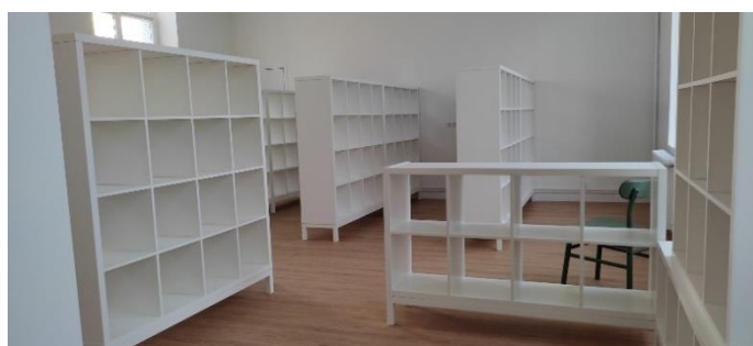
Photos prises pendant les travaux d'aménagement

Ce qui change : un espace plus grand, plus lumineux.